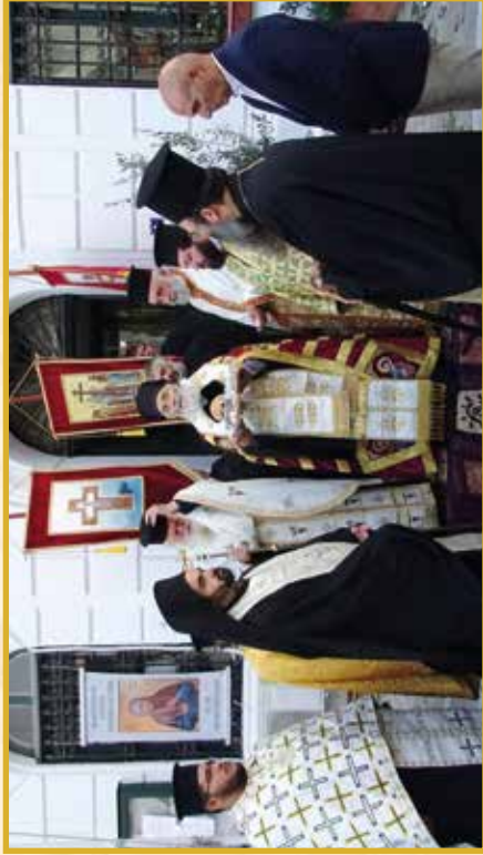
Τελετή ύποδοχής Τιμίας Κάρας Όσιας Μητρός ήμών Γαβριηλίας (Δημαρχιακό Μέγαρο Λέρου, 5-10-2023).