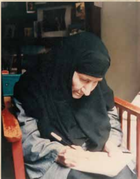
Μοναχή ΓΑΒΡΙΗΛΙΑ ΠΑΠΑΓΙΑΝΝΗ (2) 15/10/1897 - 28/3/1992

ΑΝΑΦΟΡΑ ΣΤΗΝ ΑΓΙΟΚΑΤΑΤΑΞΗ ΤΗΣ ΟΣΙΑΣ ΓΑΒΡΙΗΛΙΑΣ ΠΑΠΑΓΙΑΝΝΗ