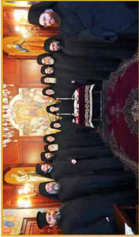
Ἡ Ἁγία καὶ Ἱερά Σύνοδος