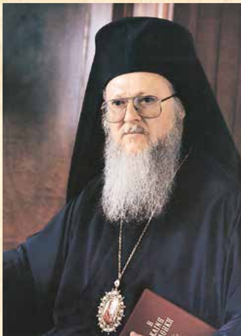
Ἡ Α.Θ. Παναγιότης, ὁ Οἰκουμενικός Πατριάρχης κ.κ. ΒΑΡΘΟΛΟΜΑΙΟΣ