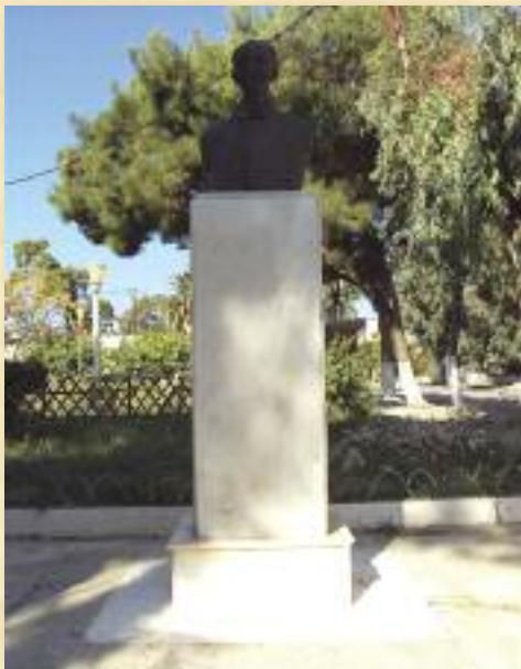
Προτομή Μανουήλ Ί. Γεδεών στό Λακκί τής Λέρου, ἔργον διασήμου Συμαίου γλύπτου Κώστα Βαλσάμη, προσφορά Πανελληνίου Ἐνώσεως Λερίων καί Δήμου Λέρου.