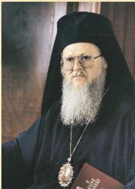
Ἡ Α.Θ. Παναγιότις, ὁ Οἰκουμενικός Πατριάρχης κ.κ. ΒΑΡΘΟΛΟΜΑΙΟΣ