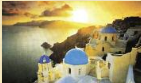
ΑΣΤΥΠΑΛΛΙΑ... μεταξύ οὐρανοῦ καὶ γῆς.