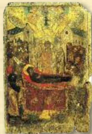
Εἰκὼν τῆς Κοιμήσεως τῆς Θεοτόκου, 16ος αἰ. μ.Χ. Ἐκκλησιαστικὸν Σκευοφυλάκιον Ἀστυπυλαίας