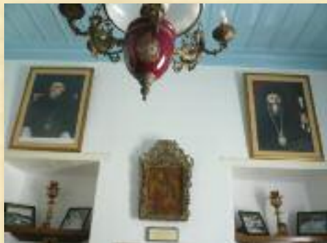
Ἐσωτερικό Ἐπισκοπεῖου νήσου Ἀστυπάλαιας