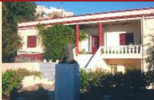
▲ ΓΕΡΒΑΣΕΙΟΣ ΣΤΕΓΗ ΘΗΛΕΩΝ ΚΑΛΥΜΝΟΥ