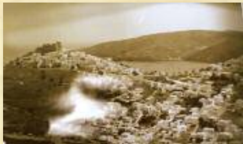
Ἡ Ἀστυπάλαια ὅπως ἦταν παλιά

(Ἀπόσπασμα ἐρευνητικοῦ προγράμματος Γυμνασίου – Λυκείου Ἀστυπάλαιας)