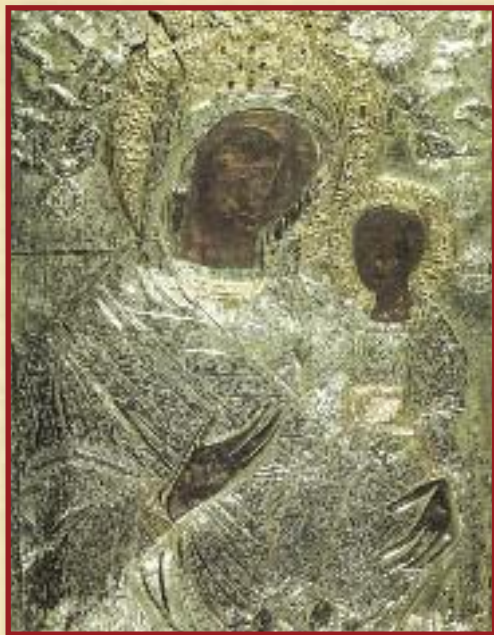
Ἡ θαυματουργὸς εἰκὼν τῆς Παναγίας τῆς Πορταῖτισσας. Εἰκὼν Τέμπλου κομισθεῖσα ὑπὸ τοῦ Ὁσίου Ἀνθίμου ἐξ Ἁγίου Ὄρους.

† Ὁ Λέρου, Καλύμνου καὶ Ἀστυπалаίας ΠΑΪΣΙΟΣ