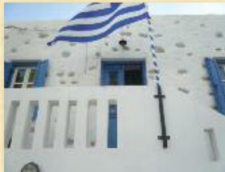
Ἐπισκοπεῖο Ἀστυπалаίας Δωρεά Ἀρχιμ. Σεραφεῖμ Στελίδη