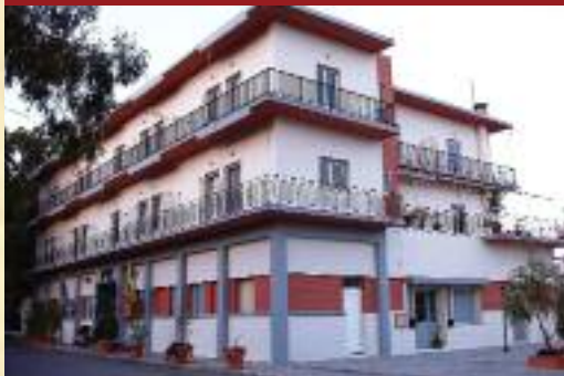
▲ ΙΣΙΔΩΡΕΙΟΝ ΘΕΡΨΙΟΝ ΧΡΟΝΙΩΣ ΠΑΣΧΟΝΤΩΝ «Η ΠΑΜΑΓΙΑ ΤΟΥ ΚΑΣΤΡΟΥ» ΛΕΦΟΥ