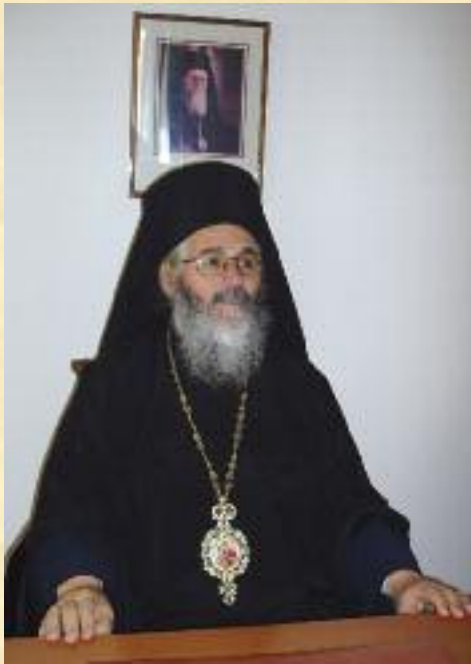
ὁ Μητροπολίτης Λέρου, Καλύμνου καὶ Ἀστυπαλαίας κ. ΠΑΪΣΙΟΣ

Ἡ Ἱερὰ Μητρόπολις Λέρου Καλύμνου καὶ Ἀστυπαλαίας εὐγνωμονοῦσα, τιμῆς