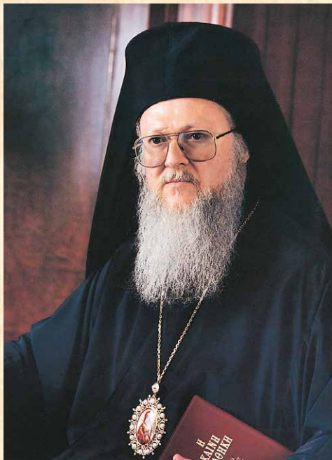
Ἡ Α.Θ. Παναγιότης, ὁ Οἰκουμενικός Πατριάρχης κ.κ. ΒΑΡΘΟΛΟΜΑΙΟΣ