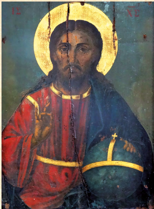
«Φῶς Χριστοῦ φαίνει πᾶσι»