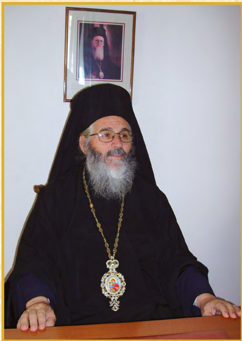
Ὁ Μητροπολίτης Λέρου, Καλύμνου καί Ἄστυπαλαίας κ. ΠΑΪΣΙΟΣ