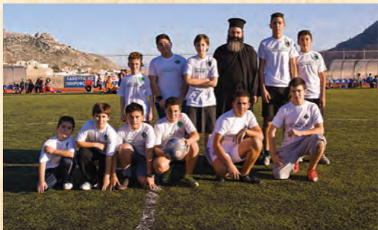
Όμάδα ποδοσφαίρου κατηχητικών ένορίας Ύπαπαντής Καλύμνου