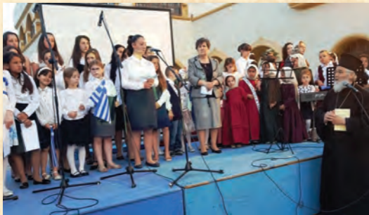
Έορτή Κατηχητικῶν στήν Κάλυμνο (2019)