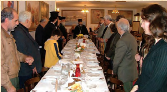
Συγκέντρωση κατηχητών Καλύμνου (Νοέμβριος 2006).