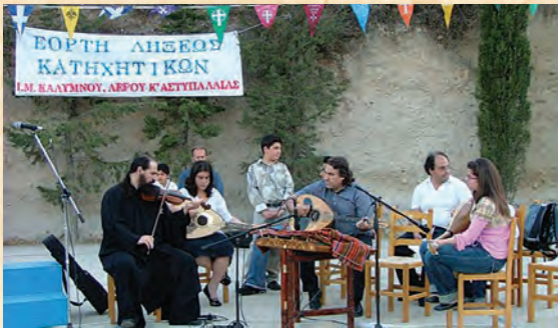
Έορτή λήξης Κατηχητικῶν στὴν Κάλυμνο (Μάϊος 2007).