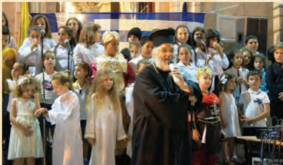
Ὁ Μητροπολίτης ανάμεσα σέ χαρούμενα κατηχητό- πουλα (έορτή κατηχητικῶν στήν Κάλυμνο, 2018).