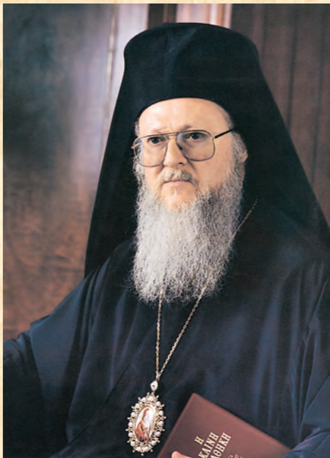
Ἡ Α.Θ. Παναγιότης, ὁ Οἰκουμενικὸς Πατριάρχης κ.κ. ΒΑΡΘΟΛΟΜΑΙΟΣ