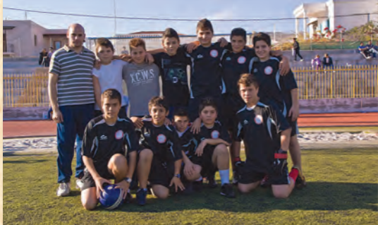
Όμάδα ποδοσφαίρου κατηχητικών ένορίας Άγίου Άθανασίου Καλύμνου