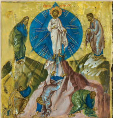
Ἡ Μεταμόρφωσις τοῦ Κυρίου (λεπτομέρεια ἐκ τῆς εἰκόνης τῆς Παναγίας τῆς Πανσολύπης).