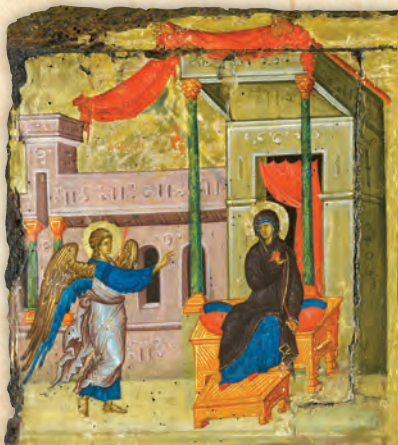
Ὁ Εὐαγγελισμὸς τῆς Θεοτόκου (λεπτομέρεια ἐκ τῆς εἰκόνος τῆς Παναγίας τῆς Παισολύπης).