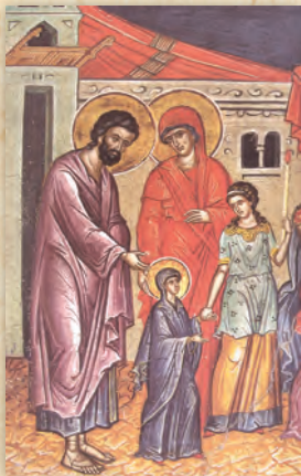
Τά Εισόδια τῆς Θεοτόκου (τοιχογραφία ἐκ τῆς Μονῆς Διονυσίου).