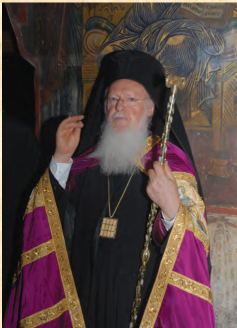
Η Α.Θ. Παναγιώτης, ὁ Οἰκουμενικός Πατριάρχης κ.κ. ΒΑΡΘΟΛΟΜΑΙΟΣ