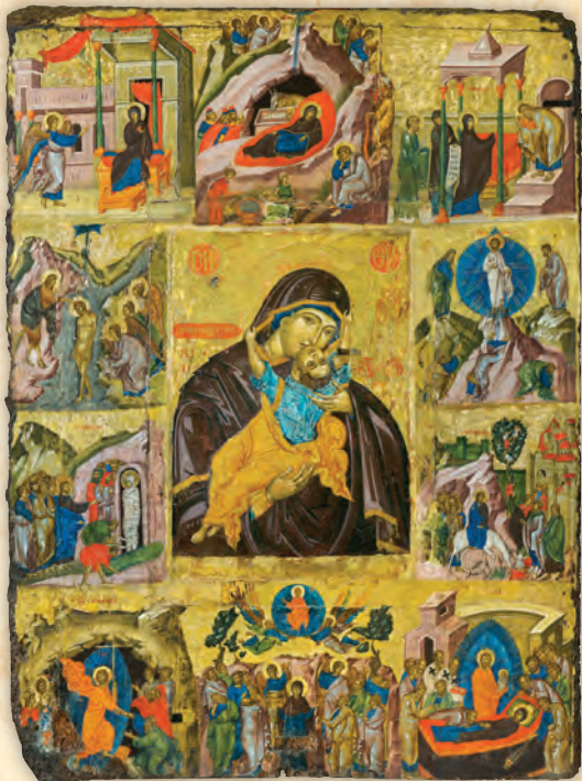
Παναγία ή Παυσολύπη.