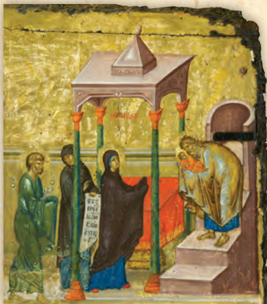
Ἡ Ὑπαπαντή τοῦ Κυρίου (λεπτομέρεια ἐκ τῆς εἰκόνας τῆς Παναγίας τῆς Πανσολύπης).