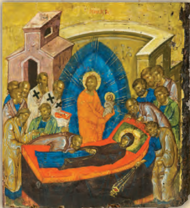
Ἡ Κοίμησις τῆς Θεοτόκου (λεπτομέρεια ἐκ τῆς εἰκόνης τῆς Παναγίας τῆς Πανσολύπης).