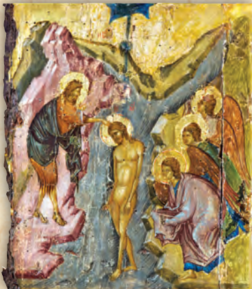
Ἡ Βάπτισις τοῦ Κυρίου (λεπτομέρεια ἐκ τῆς εἰκόνας τῆς Παναγίας τῆς Πανσολύπης).