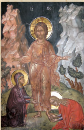
Οί Μυροφόρες (Γερά Μονή Μεγίστης Λαύρας).