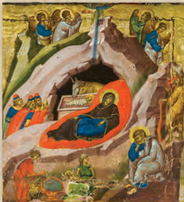
Ἡ Γέννησις τοῦ Χριστοῦ (λεπτομέρεια ἐκ τῆς εἰκόνας τῆς Παναγίας τῆς Πασσολύπης).