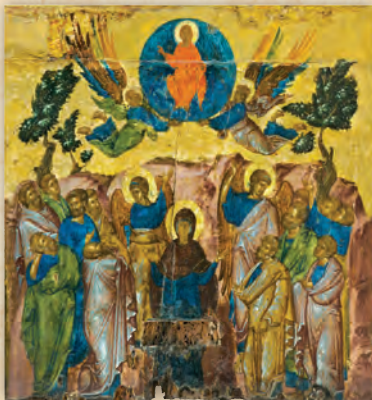
Η Ανάληψις τοῦ Κυρίου (λεπτομέρεια ἐκ τῆς εἰκόνης τῆς Παναγίας τῆς Πασσολύπης).