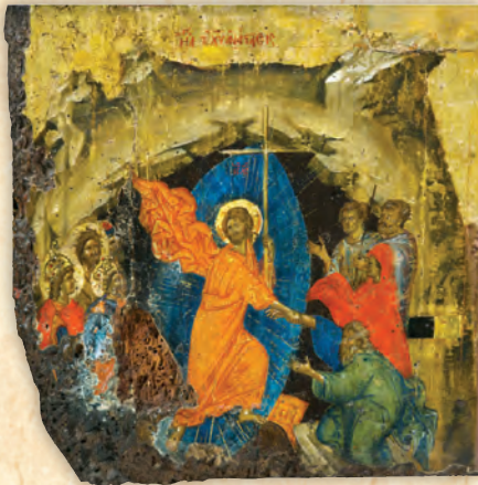
Η εις Άδου Κάθοδος (λεπτομέρεια εκ τής εικόνας τής Παναγίας τής Πανσολύπης).