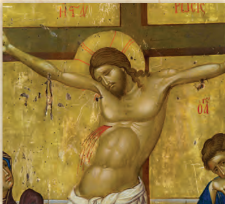
Ὁ Ἐσταυρωμένος (λεπτομέρεια ἐκ τῆς ὀπίσθιας ὄψις εἰκόνας τῆς Παναγίας τῆς Παισολύπης).