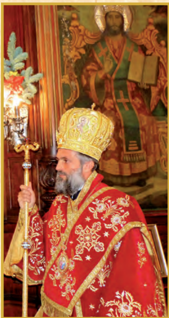
Βοηθός Ἐπίσκοπος - Πρωτοσύγκελλος Θεοφιλέστατος Ἐπίσκοπος Στρατονικείας κ. ΣΤΕΦΑΝΟΣ (Ἱεροκῆρυξ Ἱερᾶς Μητροπόλεως)