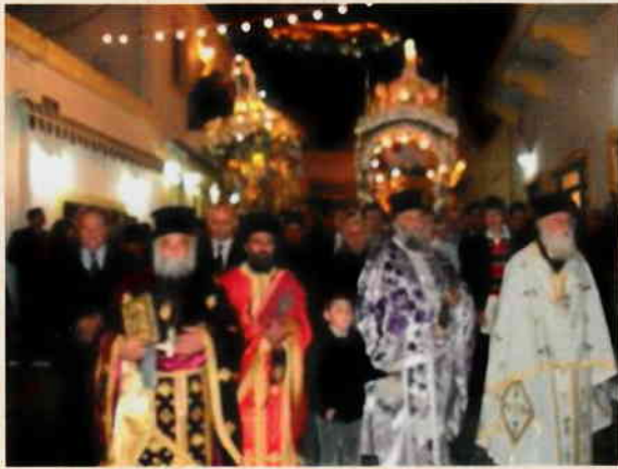
Περιφορά Επιταφίου Ι.Ναού Αγίου Νικολάου Λακκίου Λέρου

Εντυπωσιακή ήταν και εφέτο η συνάντηση στην κεντρική πλατεία Πλατάνου των τριών επιταφίων των Ενοριών της Αγίας Μαρίνης, του Ευαγγελισμού και Σωτήρος Χριστού.