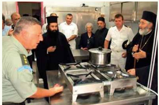
Ἐπιμέλεια, Φωτογραφίες, Βίντεο: Γεώργιος Ι. Χρυσούλης, Γραμματεῖς Ἱερᾶς Μητροπόλεως