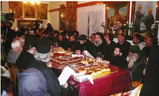
Κοπή βασιλόπιτας στήν Ἱερά Μονή Ἁγίας Αἰκατερίνης Καλύμνου