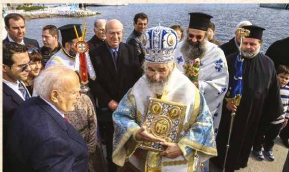
Τά Ἅγια Θεοφάνεια μέ τόν Πρόεδρο τής Δημοκρατίας στή νήσο Τέλενδο

Ἡ νήσος Τέλενδος εἶχε φέτος τήν τιμητική της, ἄφου στή νησίδα αὐτή τής Καλύμνου, γιά πρώτη φορά στήν ἱστορία της, ὁ Πρόεδρος τής Δημοκρατίας κ. Κάρολος Παπούλιας παρέστη στον ἁγιασμό τών υδάτων, μεταβάς ἐκεῖ μέ ἑλικόπτερο.