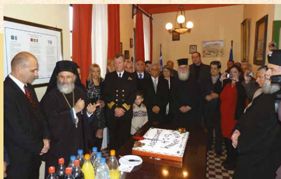
Τήν πρώτη του νέου έτους στό Δημαρχιακό Μέγαρο Λέρου

Μετά τό πέρας τής Θείας Λειτουργίας, έτελέσθη ή καθιερωμένη Δοξολογία επί τῷ νέῳ ἔτει, και ὁ Μητροπολίτης εὐχήθηκε καταλλήλως, μοιράζοντας τό