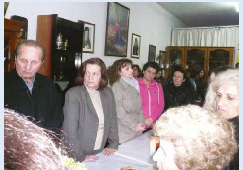
Κοπή βασιλόπιτας τοῦ Συλλόγου «Φίλων Φυλακισμένων Καλύμνου»