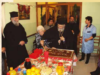
Πρωτοχρονιάτικες εὐχές στό Ἐκκλησιαστικό «Ίσιδώρειο» Γηροκομείο και στή Μονάδα Αίμοκάθαρσης του Νοσοκομείου Λέρου

Μετά τό Δημαρχείο οι Άρχές μετέβησαν στό Ίσιδώρειο Γηροκομείο μας, όπου παρουσία όλων τών γερόντων και του υπαλληλικού προσωπικού, ὁ Μητροπολίτης έκοψε τήν βασιλόπιτα του Ίδρύματος.