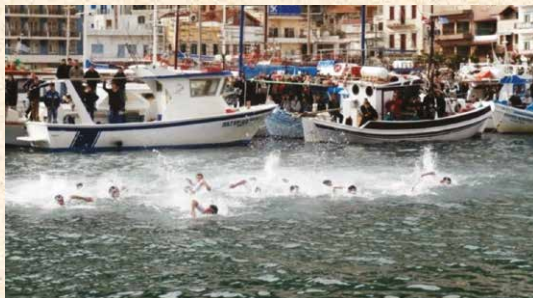
Τά Άγια Θεοφάνεια στον κεντρικό λιμένα Καλύμνου