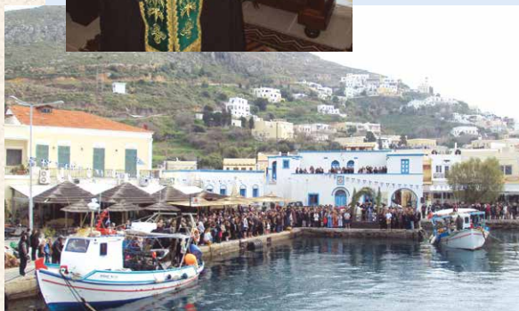
Τά Άγια Θεοφάνεια στον λιμένα Αγίας Μαρίνης Λέρου