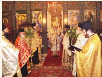
Ἡ πρώτη τοῦ νέου ἔτους 2014