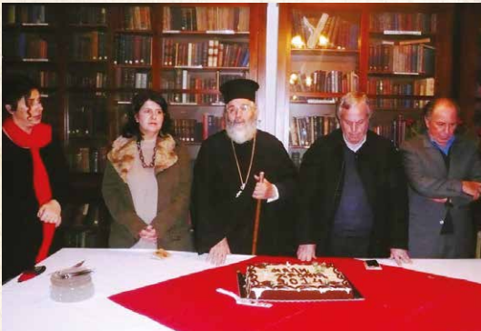
Κοπή βασιλόπιτας στό «Σολώνειο Εύγηρίας Μέλαθρον Καλύμνου»

Τό δέ έσπέρας τής αύτής ήμέρας ό Μητροπολί- της μας έχοροστάτησε στόν πανηγυρικό άρχιερα- τικό έσπερινό του Ίεροϋ Ναού Άγιου Άθανασίου Καλύμνου, επί τή μνήμη των άγιων πατέρων Άθα- νασίου καί Κυρίλλου Πατριαρχών Άλεξανδρείας, όπου καί έλειτούργησε τήν κυριώνυμον ήμέρα καί έκήρυξε τόν Θεϊον Λόγον, προτρέποντας τούς πιστούς νά μιμηθούν τήν άκλόνητον πίστην καί γενναϊότητα του άγιου Πατρός ήμών Άθανασίου.