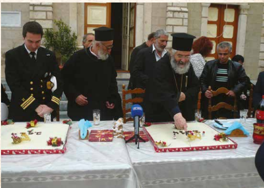
Κοπή βασιλόπιτας Λιμεναρχείου Καλύμνου