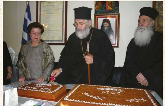
Κοπή βασιλόπιτας στό «Λύκειο Ἑλληνίδων Καλύμνου»