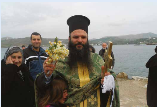
Τά Άγια Θεοφάνεια στην ένορία Όσίας Ειρήνης Χρυσοβαλάντου (Δρυμώνας Λέρου)