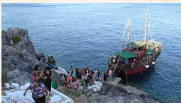
Εορτασμός Αγίας Κυριακής, Λέρος 6 και 7.7.2014