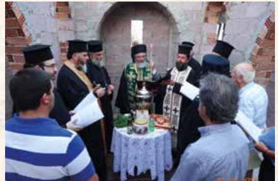
Ἀπὸ τὴν τελετὴ θεμελίωσης τοῦ παρεκκλησίου τοῦ Ὁσίου Χριστοδούλου στὴ Λέρο (31.7.2014)