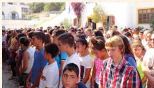
Στό «Μπελλένειο» Γυμνάσιο καί «Μπουλαφέντειο» Λύκειο Λέρου