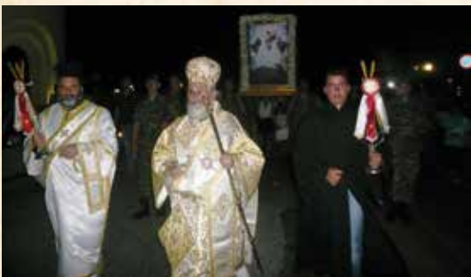
Άπό τόν έορτασμό τού Ι. Μητροπολιτικού Ναού τής Θείας Μεταμορφώσεως Σωτήρος Χριστού Καλύμνου 5 καί 6.8.2014