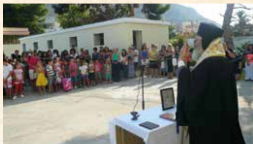
Άγιασμός στα εκπαιδευτήρια της Καλύμνου