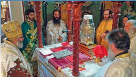
Εορτασμός Αγίας Μαρίνης, Λέρος 16 και 17.7.2014