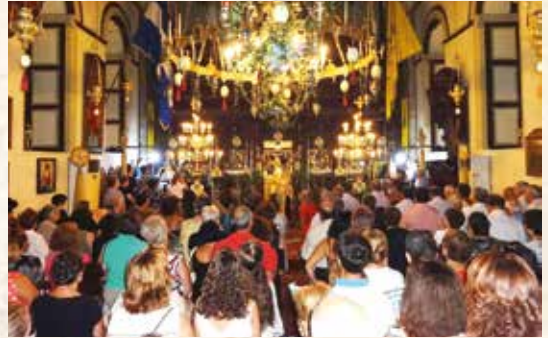
Άπό τόν έορτασμό τού Ι. Ναού τής Θείας Μεταμορφώσεως Σωτήρος Χριστού Λέρου 5 καί 6.8.2014