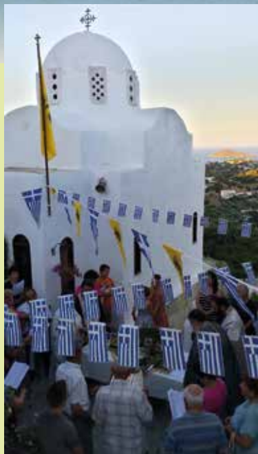
Εορτασμός Παναγίας Βλαχέρνας, Λέρος 1η Ιουλίου 2014