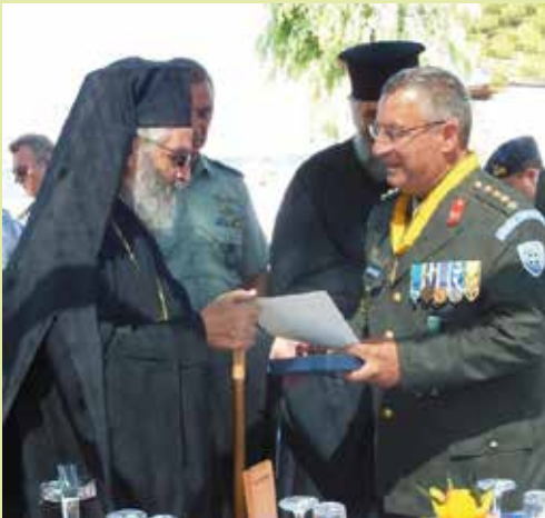
Ὁ Μητροπολίτης μας εὐλόγησε τὴν ἀλλαγὴ στρατιωτικῶν Διοικήσεων στὴ Λέρο καὶ Κάλυμνο