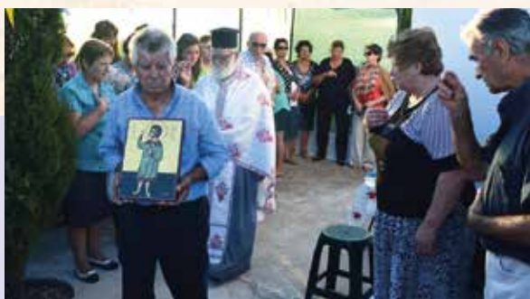
Εορτασμός Αγ. Κηρύκου και Τουλίττης, Λέρος 14.7.2014