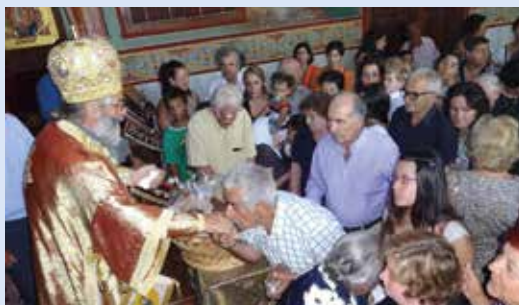
Εορτασμός Όσιας Ειρήνης Χρυσοβαλάντου, Λέρος 27 και 28.7.2014