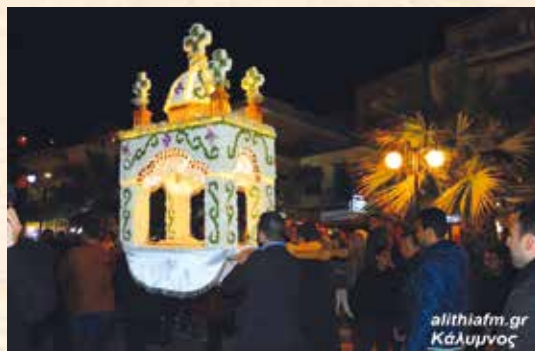
Μεγ. Παρασκευή - Περιφορά έπιταφίων στην Κάλυμνο