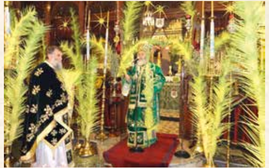
Κυριακή τών Βαΐων - Μεγ. Δευτέρα - Μεγ. Τετάρτη