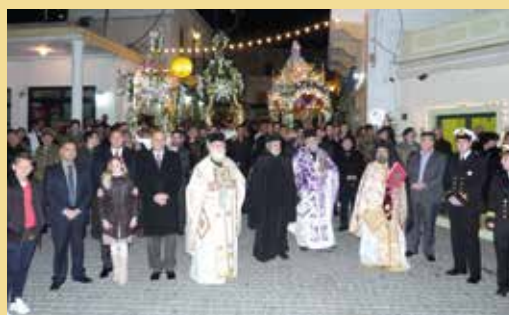
Μεγ. Παρασκευή - Μεγ. Σάββατο - Κυριακή του Πάσχα στη Λέρο