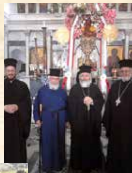
Άπό τήν έπίσκεψη στην Ί. Μονή Παναγίας Φλεβα- ριωτίσσης και στά κτήματα του ΕΦΤΑ.

Έπιμέλεια: Γ.Ι.Χ., Φωτ.: Γεώργιος Γαμπήρης