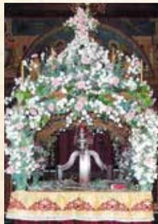
Όσιας Ειρήνης Χρυσ/ντου