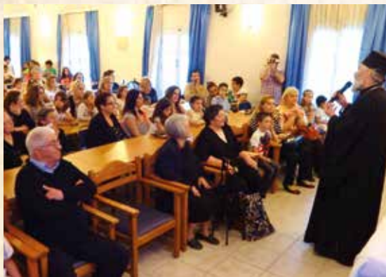
Άπό τήν έκδήλωση για τήν γιορτή τής Μητέρας, από τά εκπαιδευτήρια ξένων γλωσσών «Καρανικόλα» στο Συεδριακό Κέντρο «Σχολή Σοφίας» στη Λέρο