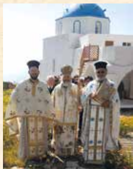
Άπό τόν έορτασμό του Άπ. Θωμά

Ο Μητροπολίτης μας κ. Παΐσιος, στά πλαίσια τών επισκέψεών του στην μακρινή Άστυπάλεια, τέλεσε τό Έσπερας του Σαββάτου 18.4.2015 Άρχιερατικό Έσπερινό, και τό πρωί τής Κυριακής του Θωμά 19.4.2015 Άρχιερατική Θεία Λειτουργία, μετά τήν όποία έλαβε χώρα Ίερά Λιτάνευσις τής Άγίας Εικόνας του Άπ. Θωμά. Τήν έπομένη, Δευτέρα 20.4.2015, ό Μητροπολίτης έπισκέφθηκε τήν Ίερά Μονή Παναγίας Φλεβαριωτίσσης, καθώς έπίσης και τίς κτηματικές έκτάσεις του ΕΦΤΑ, και ένημερώθηκε για τά τρέχοντα προβλήματα του Ίδρύματος.