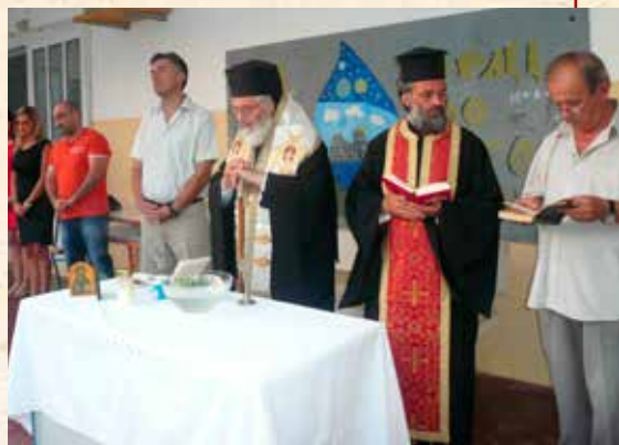
Γενικό Λύκειο, «Μπελλένειο» Γυμνάσιο καί Έσπερινό.