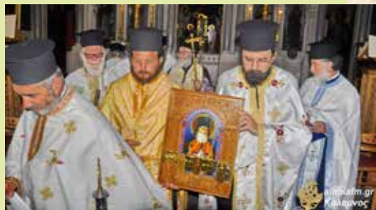
Ἀπό τά ἐγκαίνια τοῦ Ἱεροῦ Ναοῦ Ἁγίου Λουκά τοῦ Ἰατροῦ στήν Κάλυμνο (22.6.2015).