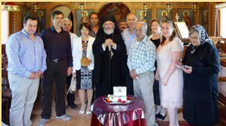
Ἀπό τόν ἑορτασμό τοῦ Ἁγίου Παΐσιου Παναγῆ Μπασιά στή Λέρο (7.6.2015)