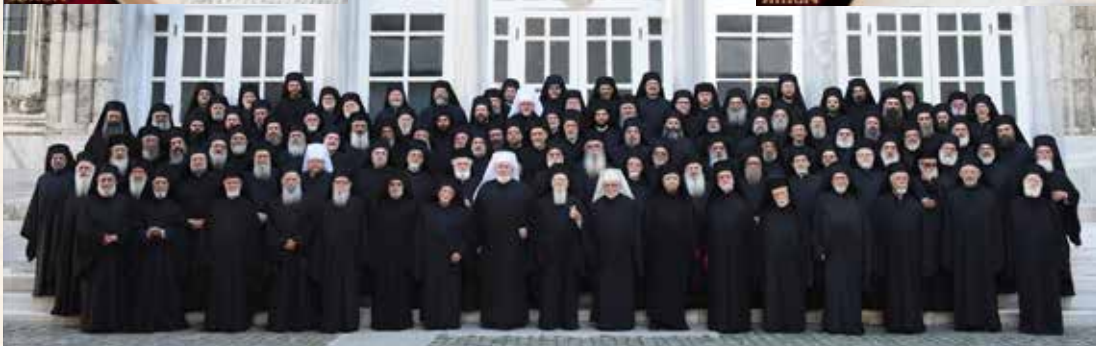
Ἀπὸ τὴν ἐορτὴ τῆς Ἰνδικτοῦ καὶ τὴν Σύναξιν τῆς Ἱεραρχίας τοῦ Οἰκουμενικοῦ Πατριαρχείου στὸ Φανάρι, κατὰ τὴν ὁποία συμμετεῖχε καὶ ὁ Μητροπολίτης μας κ. Παῖσιος