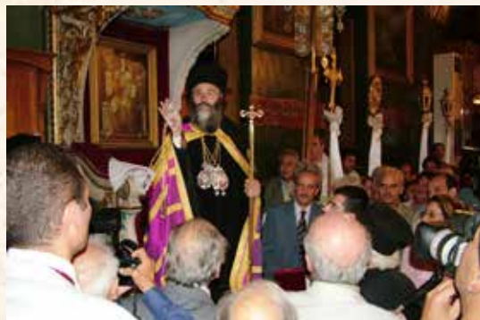
25 Ἰουνίου 2005 - ἀπὸ τὴν τελετὴ ἐνθρονίσεως στὴ Λέρο καὶ Κάλυμνο.