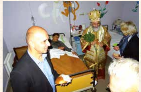
Εορτή τῶν Ἁγίων Ἀναργύρων στό Νοσοκομεῖο τῆς Λέρου.