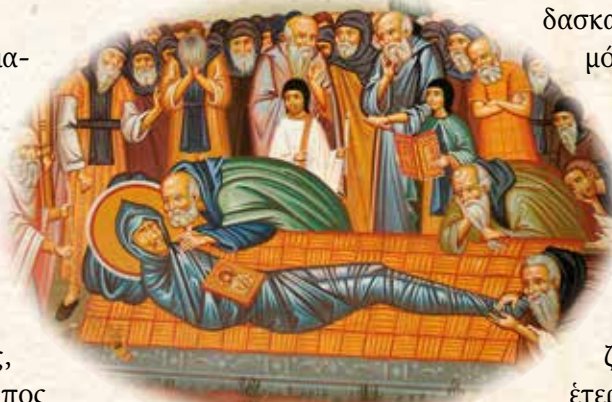
Κοίμησι τοῦ Ὁσίου Ἐφραίμ.

Τό πότε ἐπέρχεται ὁ θάνατος δέν εἶναι πλέον ὑπόθεση τῆς ἰατρικῆς ἐπιστήμης. Τό ὄλο θέμα ἐμπλέκεται μέσα στά ἐνδιαφέροντα τῆς ἠθικῆς, τῆς πολιτικῆς, τῆς κοινωνιολογίας καί τῆς νομικῆς, ἐνδεχομένως καί ἄλλων ἐπιστημῶν, πού ἡ κάθε μιά τό βλέπει κάτω