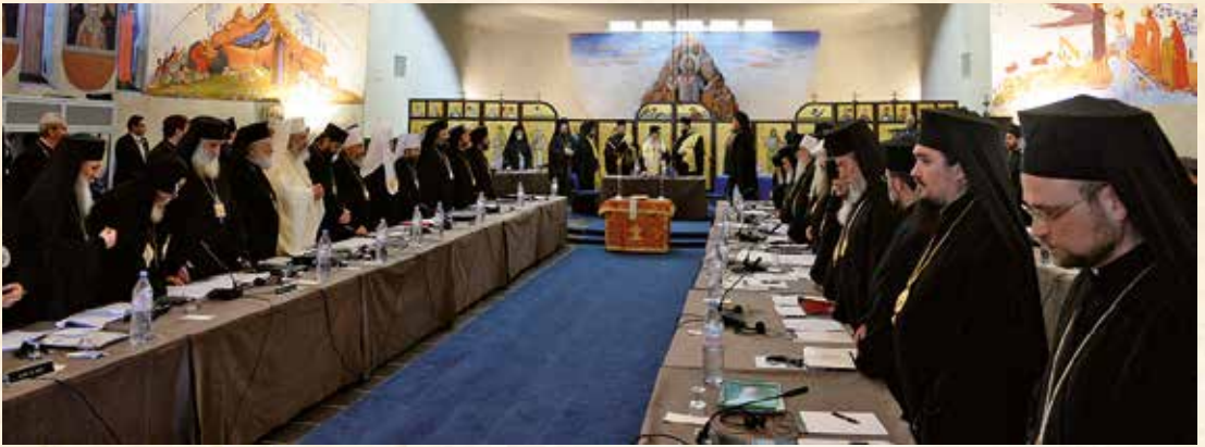
Από τή σύνοδο έργασίας τῆς Σύναξης τῶν Προκαθημένων τῶν Ὁρθοδόξων Ἐκκλησιῶν 23/1/2016, Γενεύη, Ἑλβετία.

κλησίας καί οἱ ἱεροὶ κανόνες τῆς φέρουν τήν σφραγιδα τῆς συνοδικότητος. Ἡ Ὁρθοδοξία εἶναι ἡ Ἐκκλησία τῆς συνοδικότητος.