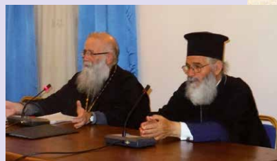
Άπό τίς δραστηριότητες τής Σχολής Γονέων τής Μητροπόλεως σέ Λέρο και Κάλυμνο.