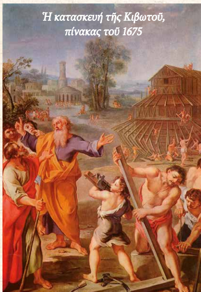
Ἡ κατασκευή τῆς Κιβωτοῦ, πίνακας τοῦ 1675

ζει ἀπλῶς, ἀλλά τούς κάνει καί ἀλλάζουν.» 1 . Αὐτό τό καράβι πορεύεται μέσα στούς αἰῶ- νες ἀσταμάτητα καί συνεχίζει μέ προορισμό τά ἔσχατα καί τήν αἰωνιότητα. Στήν πορεία του αὐτή συναντᾶ διάφορα ἐμπόδια καί προ- σπαθεῖ νά τά ἀντιμετωπίσει μέ ὅλες του τίς δυνάμεις. Ἡ Ἐκκλησία συνάντησε πολλά ἐμπόδια-προβλήματα (αιρέσεις, σχίσματα κ.ἄ.) ἐντός καί ἐκτός τῶν κόλπων της καί ὅταν αὐτά λάμβαναν μεγάλη ἔκταση τά ἀντι- μετώπιζε συλλογικά, ἢ ὅπως θά λέγαμε στήν ἐκκλησιαστική γλῶσσα συνοδικά. Ἡ Σύνο- δος εἶναι μιά μορφή συνάν- τησης ὅλων ἡ μερίδας τῶν Ἐπισκόπων μιᾶς τοπικῆς Ἐκκλησίας ἢ ἀκόμα καί ὅλων τῶν τοπικῶν Ὁρθο- δόξων Ἐκκλησιῶν. Αὐτή ἡ μορφή διοίκησης τῆς Ἐκ- κλησίας ἔχει βαθιά πνευμα- τική θεμελίωση «Ἡ παρου- σία τοῦ Θεοῦ βρίσκεται μέσα στήν ἀγάπη τοῦ Σώ- ματος, στόν ἀγαπητικό δε- σμό, πού μεταβάλλει τό πλήθος σέ ἐν Χριστῷ “Ἐν” αὐτό ἀκριβῶς τό θαῦμα τῆς θείας φιλανθρωπίας ἀποτε- λεῖ τό βᾶθρο τῆς συνοδικῆς