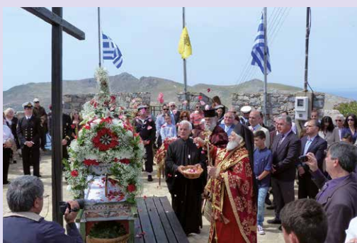
Μεγ. Παρασκευή - Άποκαθήλωση στην «Παναγία του Κάστρου» Λέρου.