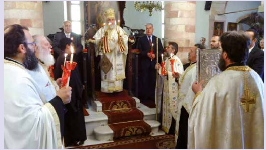
Κυριακή του Πάσχα στον Γ. Μητρ. Ναό «Εύαγγελισμός τῆς Θεοτόκου».