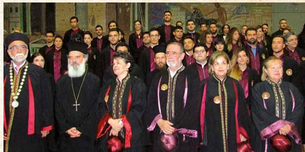
Οί καθηγητές, μέ τούς νέους πτυχιούχους.

Οί εύχές του περιοδικού μας: Βαθιά συγκινημένοι όλοι μας, εύχόμαστε στους νέους Θεολόγους νά φανούν άξιοι του λειτουργήματός τους, από όπουδήποτε κι άν τό άσκούν. Αισθανόμαστε δέ περήφανοι που οί σελίδες του περιοδικού μας κοσμούνται από τήν γραφίδα των νέων αυτών Θεολόγων. Συγχαρητήρια! 🙏