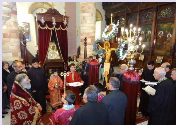
Μεγ. Παρασκευή - Άποκαθήλωση Τ. Μητροπολιτικός Ναός «Εὐαγγελισμός τῆς Θεοτόκου» Λέρου.