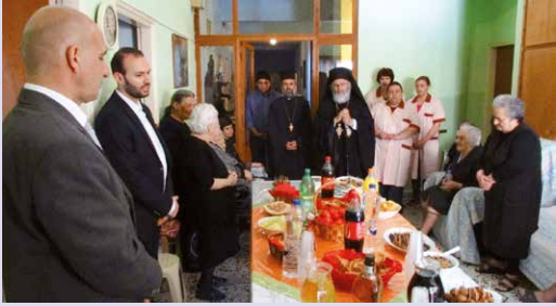
Πάσχα, κοντά στα γεροντάκια του «Ίσιδωρείου» Γηροκομείου.