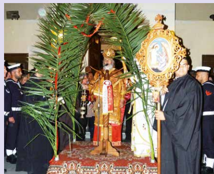
Μέγα Σάββατο - Άφιξη Αγίου Φωτός καί Ανάσταση στη Λέρο.