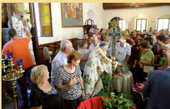
“Υψωση Τιμίου Σταυρού 2017

τους, αυτοί ζητάνε να βρουν σοφία, « ἡμεῖς κηρύσσομεν Χριστόν ἐσταυρωμένον ».