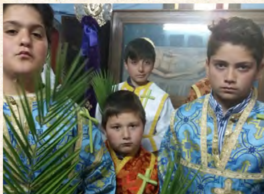
Κυριακή τῶν Βαΐων στήν Κάλυμνο (Ἱερός Ναός Παναγίας Κεχαριτωμένης Χώρας)