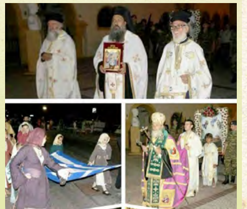
Τερά Πανήγυρη Ιερού Μητροπολιτικού Ναού Σωτήρος Χριστού Καλύμνου - 5/8/2017