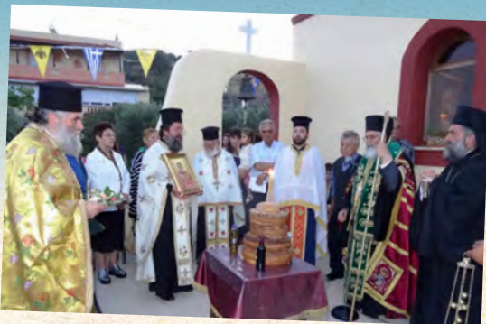
Άγιου Παϊσίου Παναγή Μπασιά στη Λέρο - 7/6/2017