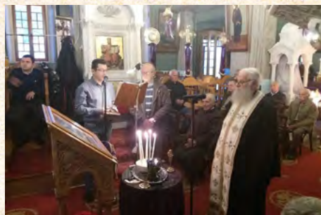
Μεγάλη Τρίτη και Μεγάλη Τετάρτη στην Κάλυμνο (Ι. Ν. Αγίου Ιωάννου του Θεολόγου και Ι. Ν. Αναστάσεως)