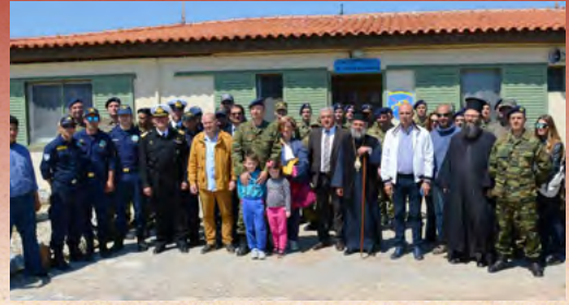
Άνάσταση στην Καλόλιμνο και στο Φαρμακονήσι