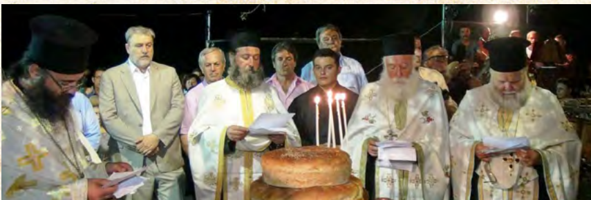
Άγιου Παντελεήμονος Καλύμνου - 26/7/2017