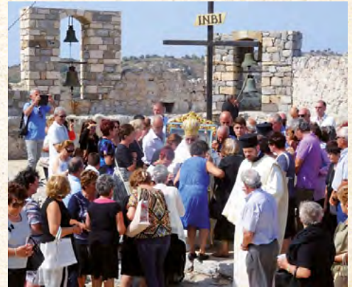
Δεκαπενταύγουστος και Έννιαμέρα στην Παναγία του Κάστρου Λέρου