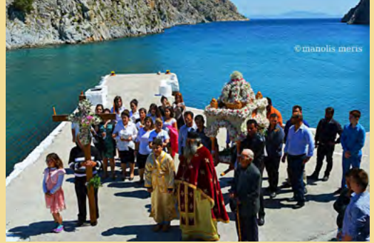
Περιφορά Έπιταφίων στην Κάλυμνο