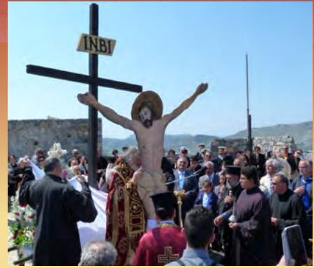
Μεγάλη Παρασκευή - τελετή αποκαθηλώσεως στην Παναγία του Κάστρου Λέρου