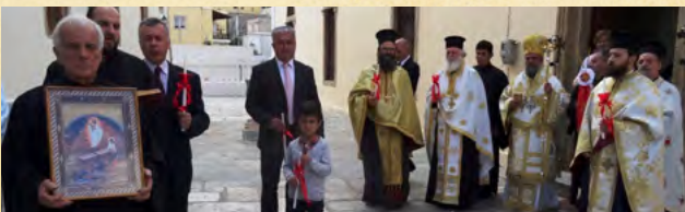
Πάσχα στη Λέρο