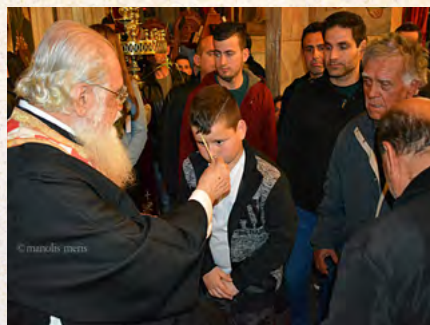
Μεγάλη Τετάρτη - Τό Μυστήριο του Γερού Εύχελαίου στόν Ι. Ν. Αγίου Σάββα Καλύμνου και Ι. Ν. Αγίου Στεφάνου