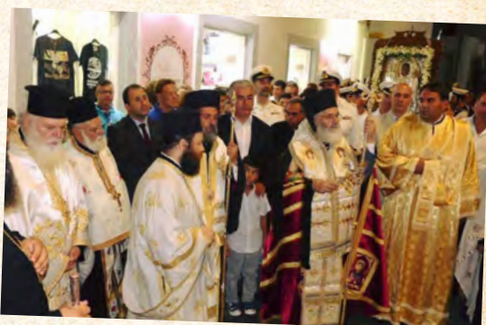
Άγίας Μαρίνης στη Λέρο - 16/7/2017