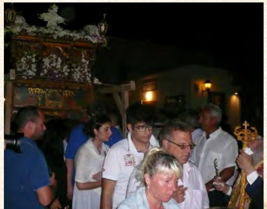
Δεκαπενταύγουστος στήν Ἀστυπάλαια