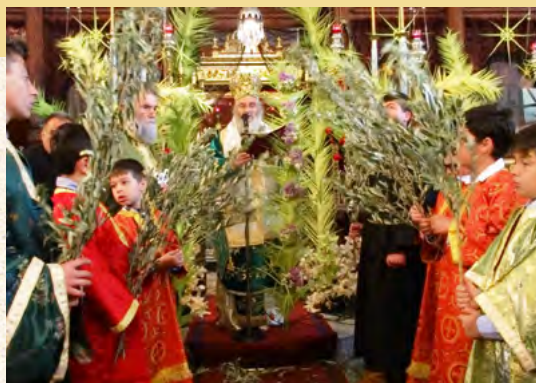
Κυριακή τῶν Βαΐων στή Λέρο (Ἱερός Ναός Σωτήρος Χριστοῦ)