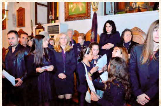
Μεγάλη Πέμπτη βράδι - Τό «μοιρολόι του Χριστού» στίς ένορίες Εϋαγγελισμού καί Σωτήρος Χριστού Λέρου