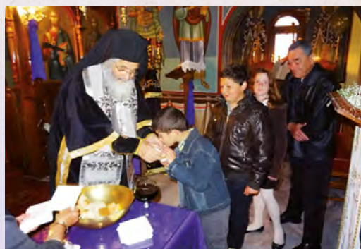
Μεγάλη Τετάρτη στη Λέρο (Γερός Ναός Αγίου Φανουρίου)