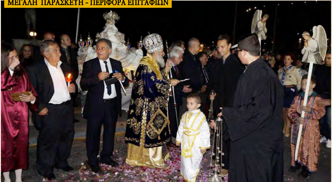
Περιφορά Έπιταφίων στην Κάλυμνο