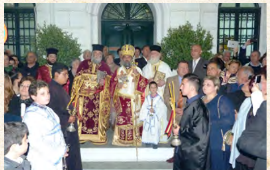
Περιφορά Έπιταφίων στη Λέρο