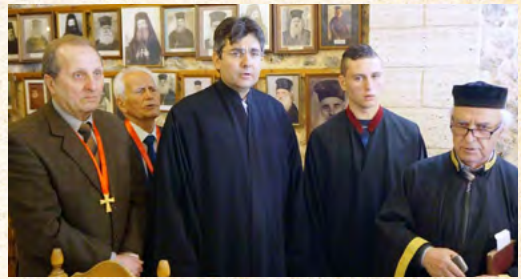
Πάσχα στην Κάλυμνο