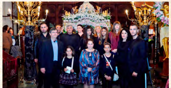
Μεγάλη Πέμπτη - στολισμός έπιταφίων