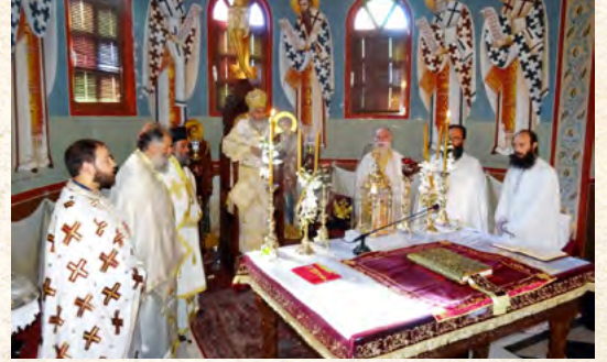
Όσιας Ειρήνης Χρυσοβαλάντου Λέρου - 28-29/7/2017