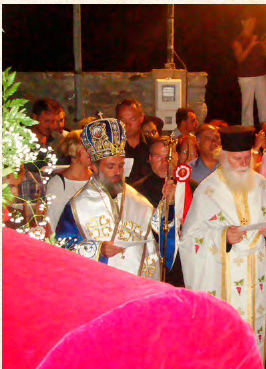
Δεκαπενταύγουστος στην Παναγία του Κάστρου Λέρου