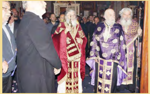
Μεγάλη Πέμπτη στήν Κάλυμνο - Ακολουθία τών Παθών του Κυρίου στόν Ίερό Ναό Αγίου Νικολάου