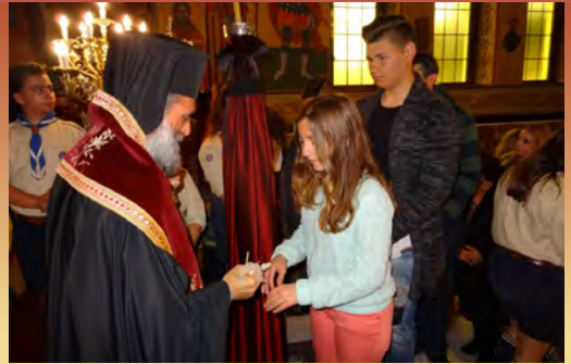
Μεγάλη Τετάρτη - Τό Μυστήριο του Ίεροϋ Εϋχελαιίου στόν Ίερό Ναό Αγίου Νικολάου Λακκίου Λέρου