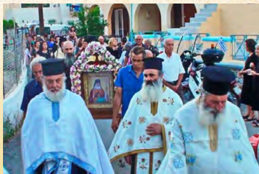
Άγιου Λουκά του Ύατροῦ στην Κάλυμνο - 10/6/2017