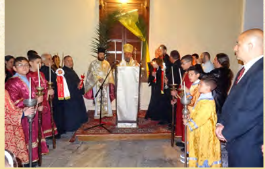
Άγιο Φῶς καὶ Ἀκολουθία Ἀναστάσεως στὸν Ἱερό Μητροπολιτικό Ναό τοῦ Εὐαγγελισμοῦ Λέρου