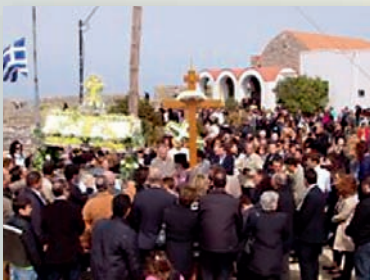
Ὁ Ἐπιτάφιος στήν Παναγία τοῦ Κάστρου Λέρου.

Βάσει τοῦ προγράμματος τῆς Ἱεραῆς Μητροπόλεως, τήν Μ. Παρασκευή τό πρωϊ ἐτελέσθη