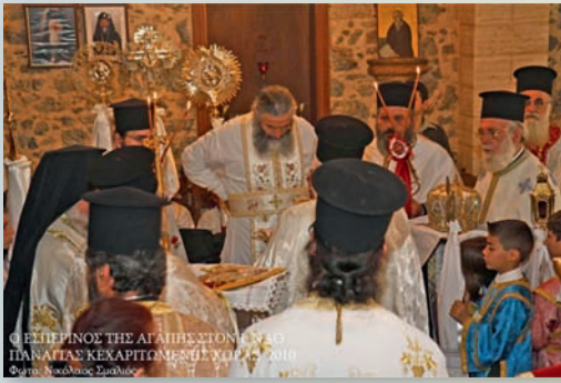
Ο ΕΣΠΕΡΙΝΟΣ ΤΗΣ ΑΓΑΠΗΣ ΣΤΟΝ ΙΕΡΟ ΝΑΟ ΤΗΣ ΠΑΝΑΓΙΑΣ ΚΕΧΑΡΙΤΟΜΕΝΗΣ ΥΠΟ ΤΟΝ 2019