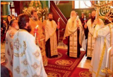
Ἱ. Μητροπολιτικός Ναός τοῦ Εὐαγγελισμοῦ τῆς Θεοτόκου Λέρου - Ἅγιον Πάσχα (Ἑσπερινός τῆς Ἀγάπης)

Τήν Κυριακή τοῦ Πάσχα, στίς 10 τό πρωῖ, στόν Ἱ. Μητροπολιτικό Ναό τοῦ Εὐαγγελισμοῦ, ἐτελέσθη ὑπό σύμπαντος τοῦ Ἱ. Κλήρου τῆς Λέρου, ὁ Ἑσπερινός τῆς Ἀγάπης, ὅπου ἀνεγνώσθη τό Εὐαγγέλιο σέ πολλές ξένες γλῶσσες.