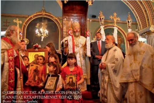
Ο ΕΣΠΕΡΙΝΟΣ ΤΗΣ ΑΓΑΠΗΣ ΣΤΟΝ ΙΕΡΟ ΝΑΟ ΤΗΣ ΠΑΝΑΓΙΑΣ ΚΕΧΑΡΙΤΟΜΕΝΗΣ ΧΩΡΑΣ ΤΟΥ 2019

νοδεία έξαπτερύγων, μετέφεραν και από τους τρεις Ιερούς Ναούς της Χώρας Ιερές Εικόνες της Παναγίας, του Προδρόμου και του Αγίου Χαραλάμπους.